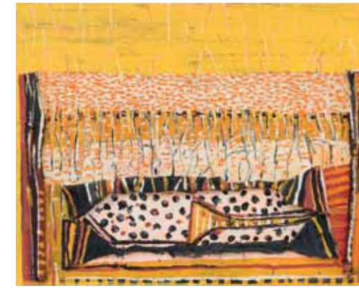
boven Theo Kuijpers, ‘Sign for magic’, 2013, Olieverf en collage op doek, 80 x 100 cm.

TK: Lesgeven heb ik hier altijd met veel plezier ge-