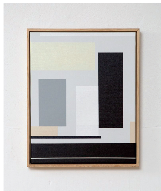
Untitled 1604, acrylverf op doek, 2016