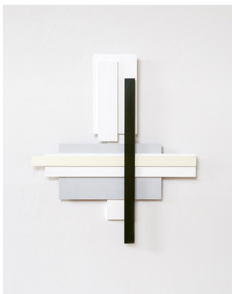
Untitled 1607, wandsculptuur, 2016

Toch spelen hier niet alleen orde, regelmaat, wetmatigheid, systematiek en primaire kleuren een rol. Els werkt met een bijzonder kleurenpalet en 3-dimensionaliteit. In deze nieuwe werken zijn de harde vormen gebleven, maar ze zijn gecombineerd met zachte kleuren. Mooie concepten die heel precies en secuur zijn afgewerkt.