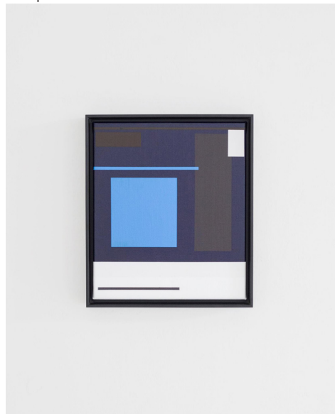
Untitled 1606, acrylverf op doek, 2016

Voor de expositie in Art Gallery O-68 heeft van 't Klooster nieuwe werken gemaakt, waarbij ze een nieuwe weg ingeslagen is. De werken zijn soberder van vorm dan eerder werk, verstillder en ingetogener van kleur. De kunstenaar laat de primaire kleuren los. De werken nodigen uit tot contemplatie.