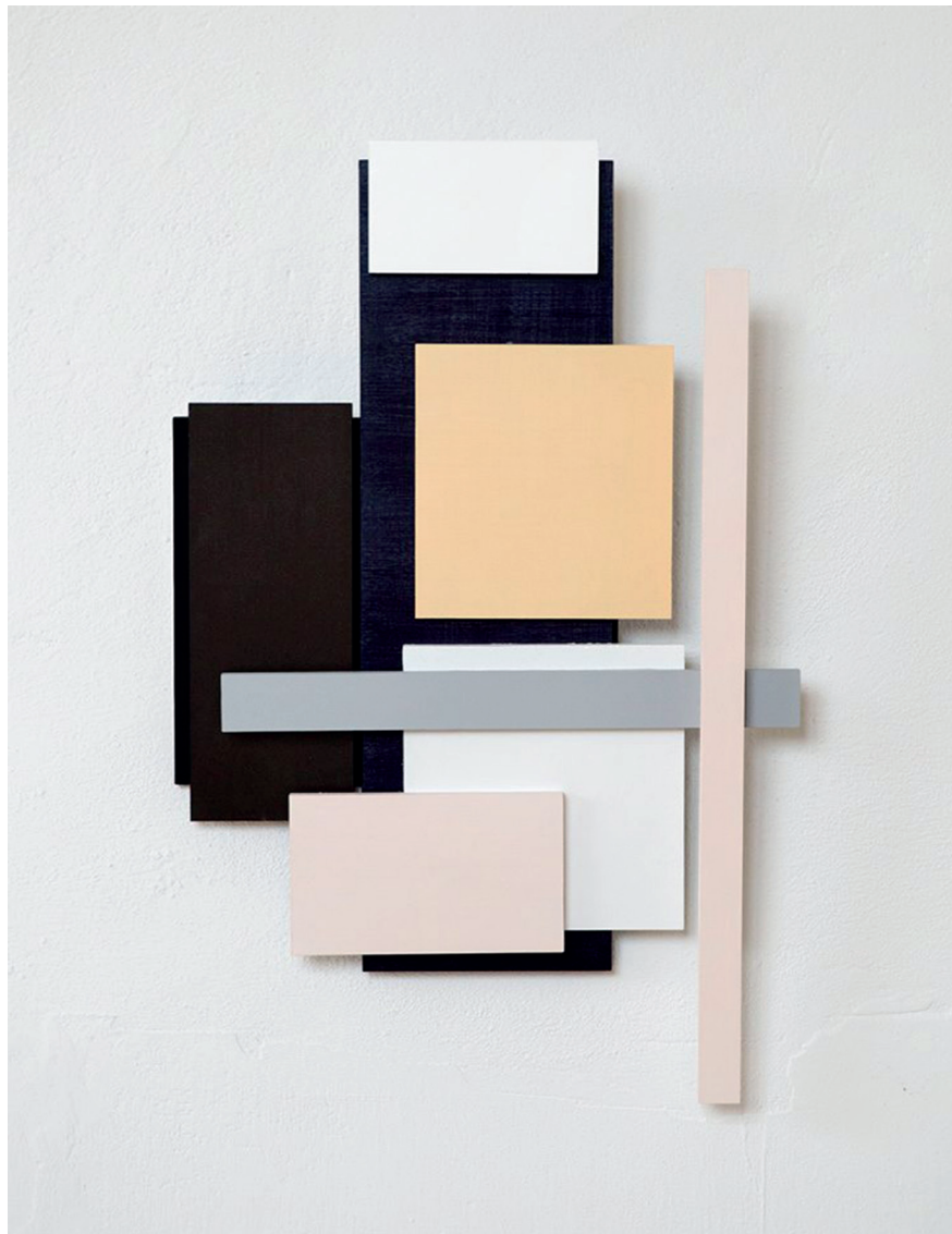
Untitled 1605, wandsculptuur, 2016